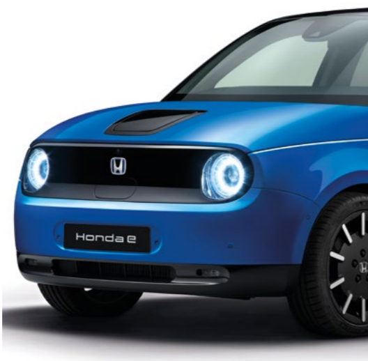
METALICKÁ PREMIUM CRYSTAL BLUE