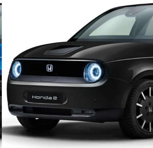
PERLEŤOVÁ CRYSTAL BLACK